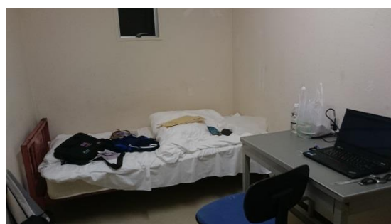
未改修宿舍房間 (中央暖氣,無冷氣)